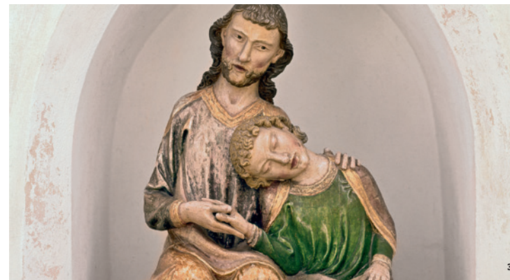
🏠 Die Christus-Johannes-Gruppe